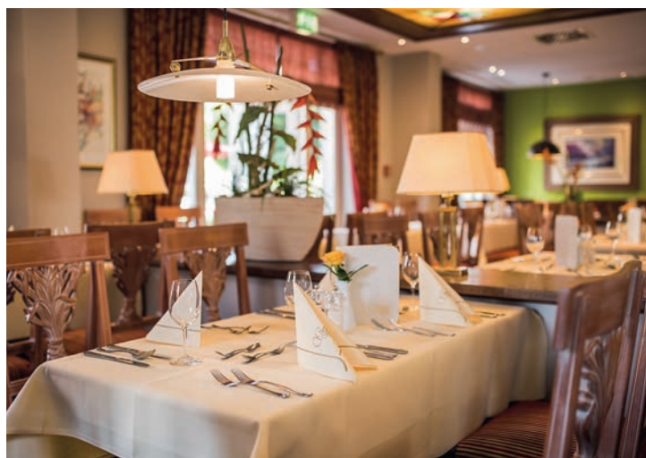
Restaurant: In stilvollem Ambiente lässt man sich kulinarisch verwöhnen.

Bad Wildungen: Mondänes Kurstadtflair in direkter Nähe zum Natur- und Nationalpark Kellerwald-Edersee.