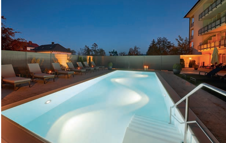
Außenpool: Der schöne Außenpool lädt zu Entspannen und Abtauchen unter freiem Himmel ein.