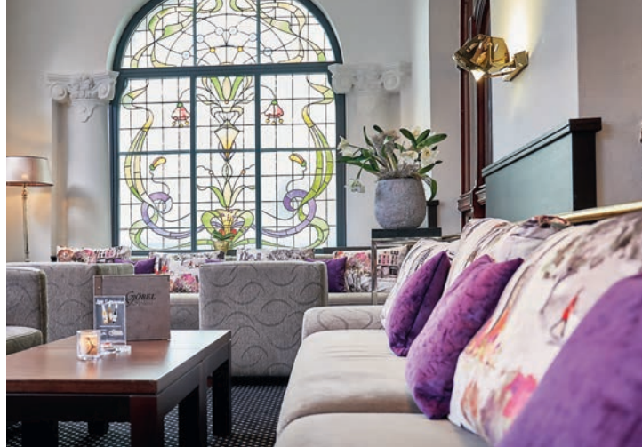
Wintergarten-Lounge: Gemütlich und stilvoll präsentiert sich die Wintergarten-Lounge für eine kleine Auszeit.

Restaurants. Abends verwöhnt ein ausgezeichnetes Küchenteam mit regionalen und internationalen Spezialitäten vom Buffet. Im charman-ten Wintergarten werden unter der Kuppelverglasung leichte Snacks und Kaffeespezialitäten serviert und in der Hotelbar klingt ein abwechslungsreicher Tag entspannt aus. Danach genießt man das Wohl-ühl-Ambiente in den modernen und stilvollen Zimmern mit hohem Komfort und hochwertiger Ausstattung.