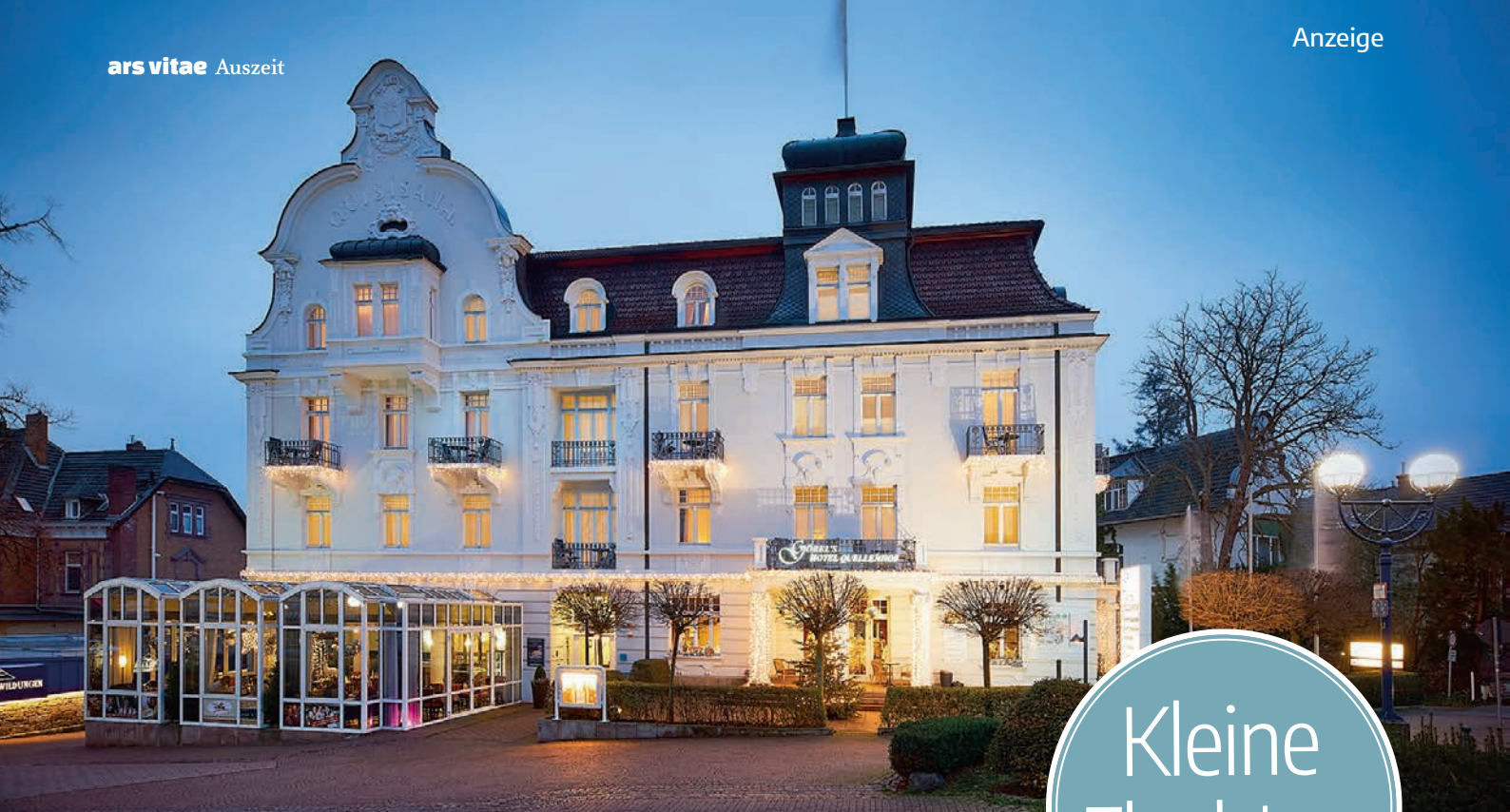
Das erste Haus am Platz: Göbel's Hotel Quellenhof in Bad Wildungen mit seiner prächtigen Jugendstilfassade.