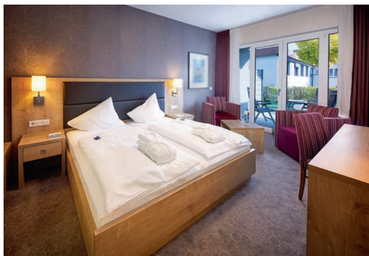
Zimmer: Moderne und großzügige Zimmer sind ideal für das Zuhause auf Zeit.